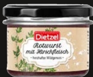
Rotwurst mit Hirschfleisch