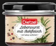
Leberwurst mit Rehfleisch