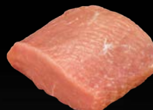
Lachsbraten vom Schwein