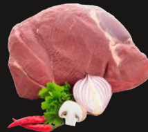
Rehbraten ohne Knochen