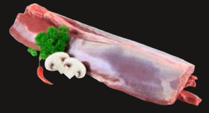
Rehrücken mit Knochen