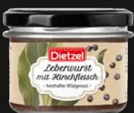
Leberwurst mit Hirschfleisch